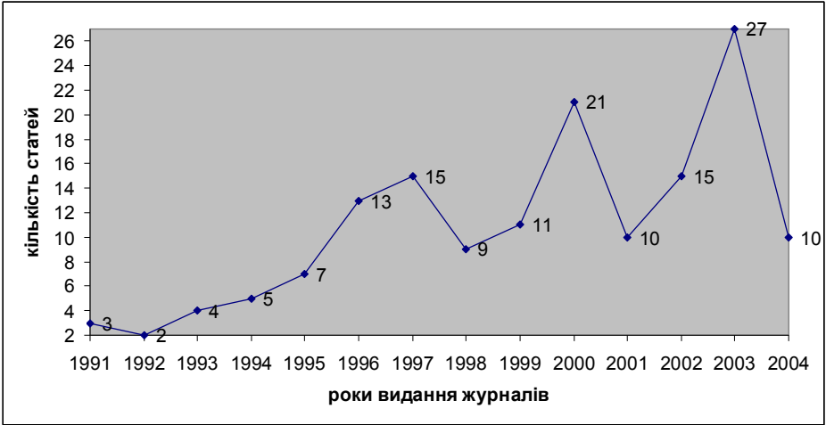
Рис. 2.3. Кількість публікацій з питання національного виховання в аналізованих журналах за період з 1991 до 2004 рр.

Цифри та перегляд графіка засвідчують таку тенденцію: з 1991 року до 1997 р. йде поступове збільшення кількості матеріалів про національне виховання (з 3-х до 15-ти), що свідчить про зростання інтересу науковців та педагогічних працівників до проблеми національного виховання; з 1998 до 2004 рр. – перемінна зацікавленість, тобто то збільшення (2000 р. – 21), то зменшення статей (2004 р. – 10). Найбільша кількість публікацій зафіксована у 2003 р. – 27. Загальна тенденція свідчить про актуалізацію проблеми національного виховання (1997 р. – 15, 2000 р. – 21, 2003 р. – 27 статей). Здається суспільство в цілому починає розуміти таку істину: «Національне виховання – то не те, що може бути або може й не бути; це першооснова демократичних засад освіти й виховання, першооснова поваги держави до самої себе» [205, 12].